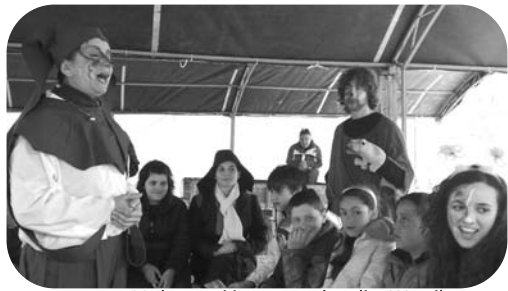
I Laboratori in una tendopoli a L'Aquila