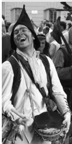
Giullari, Festa di Ludika 1243

Benvenuti, cari spettatori, al nostro IV Anno di Rassegne.