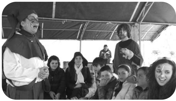
I Laboratori in una tendopoli a L'Aquila