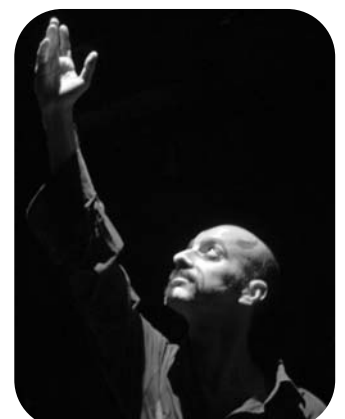
L'Inferno al Festival di Avignone Off