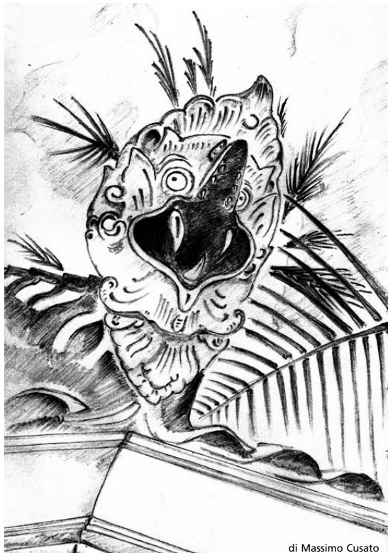
di Massimo Cusato

MANIFESTO MENSILE AUTOPRODOTTO DAL GRUPPO YGRAMUL LEMILLEMOLTE